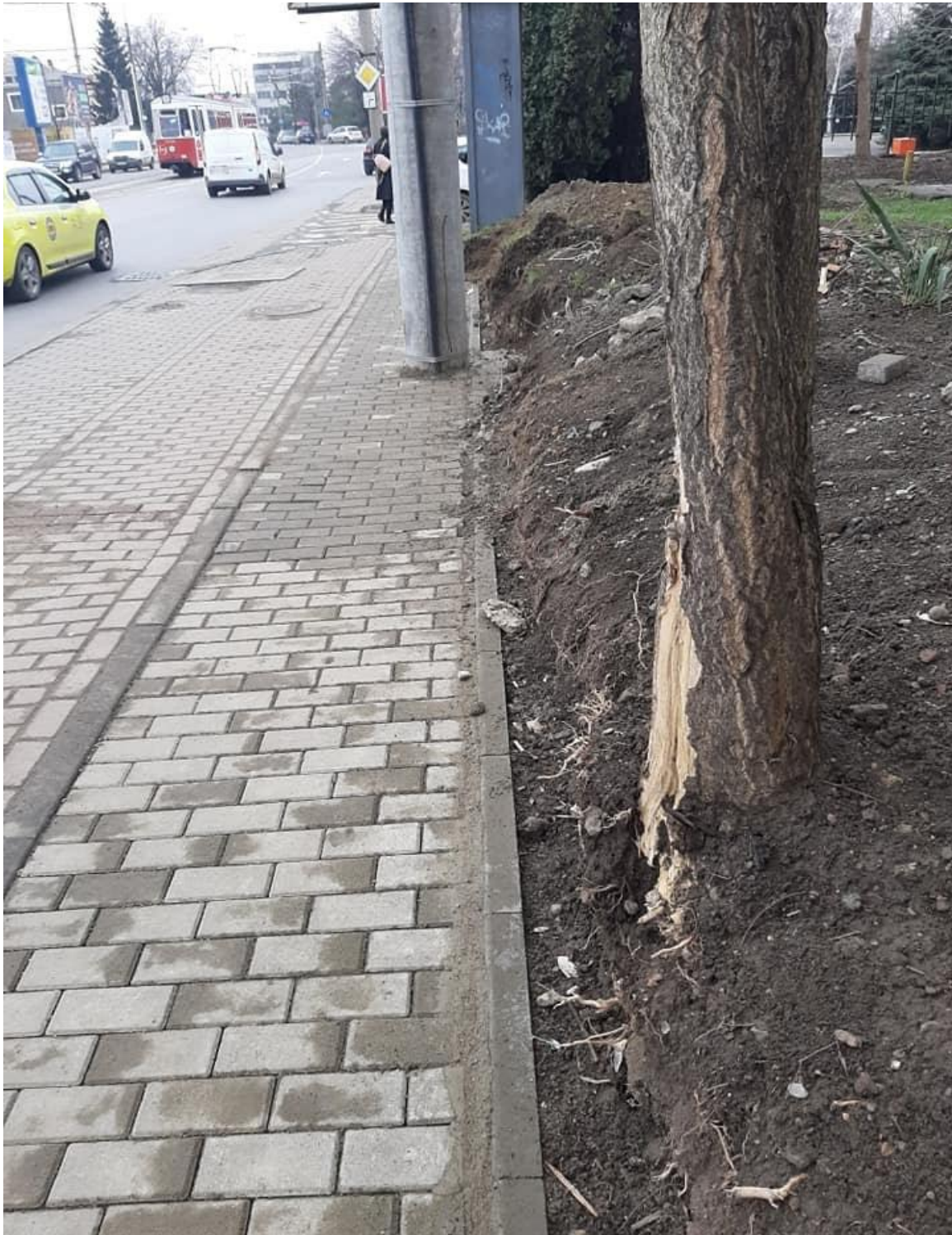
Imaginea 1: Trotuar mutat peste spațiul verde din zona Bursa Moldovei