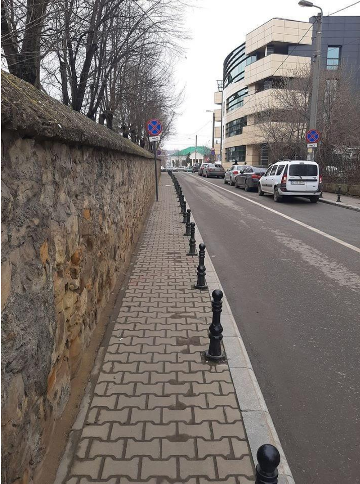
Imaginea 2: Trotuar îngust strada Bărboi (sens unic cu 2 benzi)